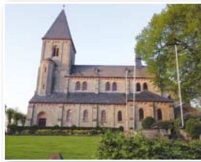
St. Clemens, Wipperfeld

Die vier Routen sind so konzipiert, dass der Rückweg in die Stadt identisch mit der Strecke der nächsten Route aus der Stadt heraus ist. So lassen sich die Außenstrecken zu einem rund 59 km langen Radrundweg um Wipperfürth Herum durch die sanft hügelige Bergische Landschaft mit wunderschönen Aussichten verbinden.