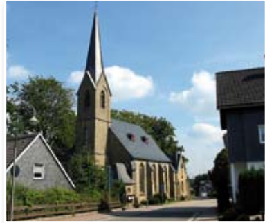
St. Agatha, Agathaberg

Die vier Routen sind so konzipiert, dass der Rückweg in die Stadt identisch mit der Strecke der nächsten Route aus der Stadt heraus ist. So lassen sich die Außenstrecken zu einem rund 59 km langen Radrundweg um Wipperfürth Herum durch die sanft hügelige Bergische Landschaft mit wunderschönen Aussichten verbinden.