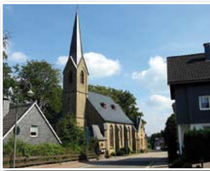
St. Agatha, Agathaberg

Diese Fahrradstrecke ist eine Teiletappe des Kirchdorfradweges Wipperfürth. Sie beginnt am Parkplatz Ohler Wiesen, quert die Innenstadt und verlässt sie über die Gaulstraße in Richtung Lindlar. Dieses Teilstück führt über eine belebte Bundesstraße; Kinder nutzen den Bürgersteig. In der Ortschaft