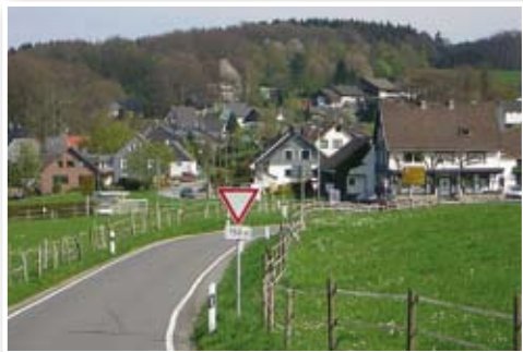
Blick auf Dohrgaul

Roppersthal verlässt man die Hauptstraße, quert die Ortschaft und erreicht das Wegekreuz in Wegerhof. Hier hält man sich links und fährt an einer Ruhebänk vorbei durch einen Wald bis nach Hermesberg. Bei schlechter Witterung biegt man an der Bank rechts nach Klespe ab und fährt dort links nach Hermesberg. In Hermesberg